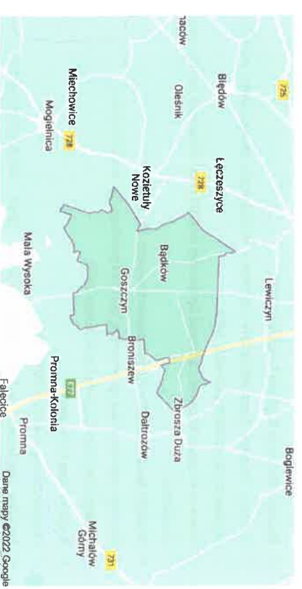
Rysunek 1. Położenie gminy Goszczyn.

Powierzchnia całkowita gminy obejmuje obszar 58 km 2 . Gmina Goszczyn jest najmniejszą gminą powiatu grójceckiego, zajmująca zaledwie 4% powierzchni powiatu. Ogólna gęstość zaludnienia wynosi ok. 50 os/km 2 . Teren podzielony jest na 11 miejscowości: Jakubów, Bądków, Dhugowola, Goszczyn, Józefów, Kolonia Bądków, Modrzewina, Nowa Dhugowola, Olszew, Romanów, Stolec, które tworzą również 11 sołectw. Goszczyn będący siedzibą władz samorządowych jest wielofunkcyjnym ośrodkiem administracyjno-usługowym i mieszkaniowym. Położony jest niemal centralnie w stosunku do obszaru gminy. Umożliwia to łatwość komunikowania się ze wszystkimi sołectwami.